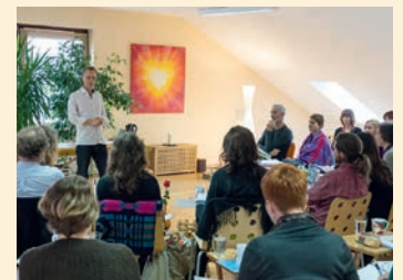
Seminarraum im Licht-Gesundheit-Energie Zentrum